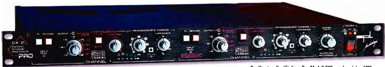
Der Urvater aller Vitalizer: Das Modell SX2 aus dem Jahre 1989.

tergehen. Eine Lösung würde sich in diesen Fällen durch das Absenken der Grenzfrequenz anbieten, was aber je nach Einstellung zu nicht erwünschten Ergebnissen führt. Doch SPL hat mit dem LC-Parameter diese Problematik optimal gelöst. Wir lassen den Mid-Hi-Regler unangetastet, drehen den separaten Intensity-Regler für das Höhen-/LC-Filter auf und kitzeln durch Sweepen mit dem LC-Parameter im Mittenbereich die zuvor verloren gegangenen Details wieder erfolgreich heraus. Einstellungen oberhalb von zehn Kilohertz sorgen in klassischer Art für mehr Luftigkeit und verleihen Mixen zudem einen Schuss an Präsenz.